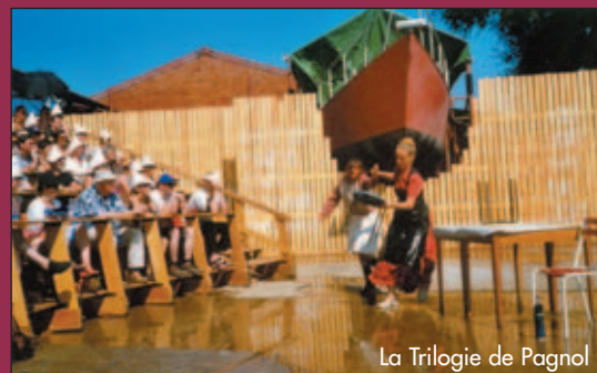
La Trilogie de Pagnol