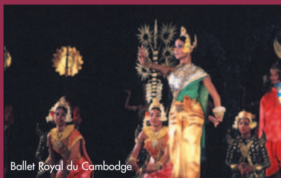
Ballet Royal du Cambodge