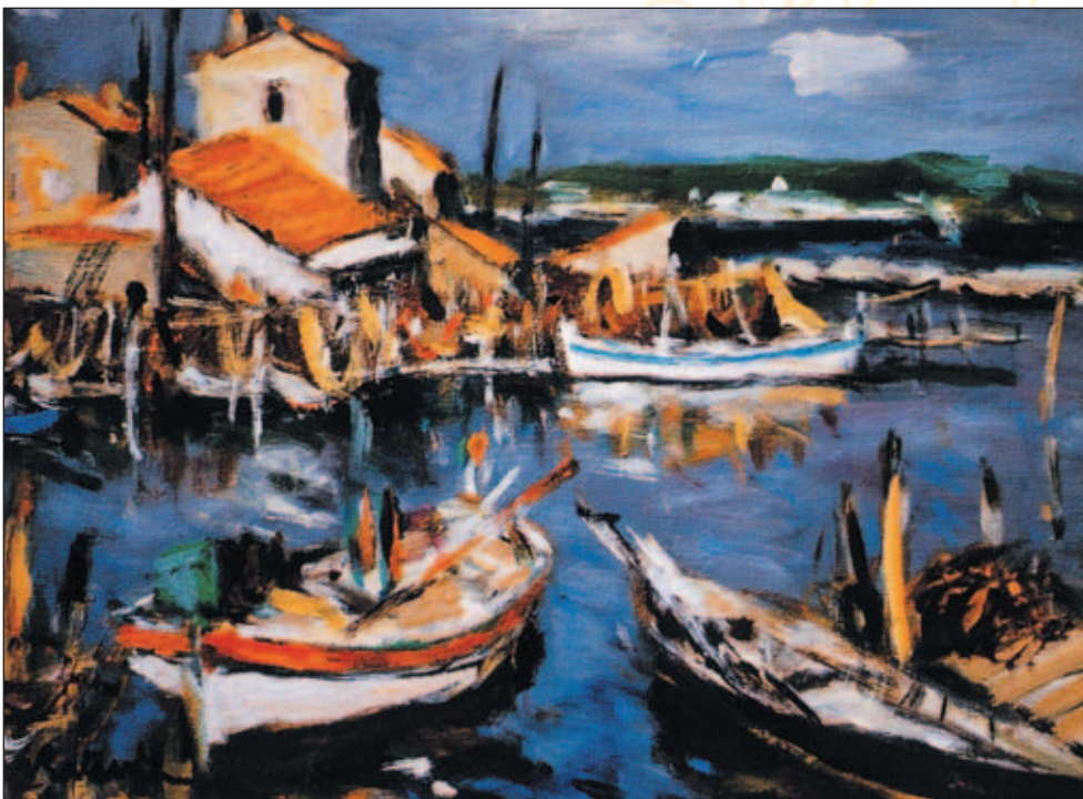
La Pointe Courte vue par Éric BATTISTA

de peintres inspirés par la petite mer intérieure. Parce qu'il sait apercevoir la singularité des riverains de Thau, Rouré, à mille lieux des guides et des revues qui se recopient sans cesse, va à l'essentiel et redonne à l'étang sa vérité première. Une bibliothèque sèteoise n'est qu'un amas de papier sans cet album qui n'a qu'un défaut : avoir attendu tant d'années pour sortir. BB