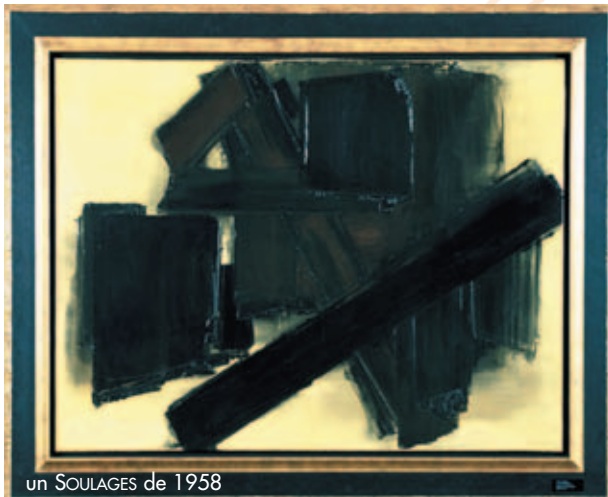
un SOULAGES de 1958

Le plus célèbre des critiques d'art français, Michel RAGON, redouté pour sa férocité de plume, vient de consacrer un ouvrage à Pierre SOULAGES (Ed. Albin MICHEL).