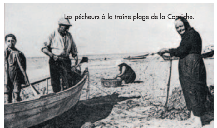
Les pêcheurs à la traîne plage de la Corniche.