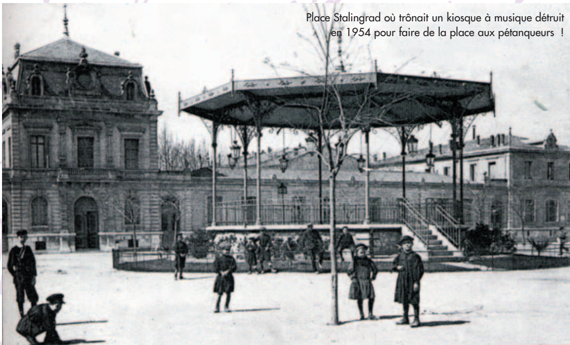
Place Stalingrad où trônait un kiosque à musique détruit en 1954 pour faire de la place aux pétanqueurs !