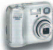
Nikon Coolpix 3200