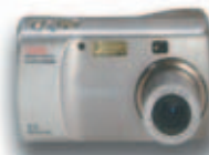
Olympus Camedia C-310Z