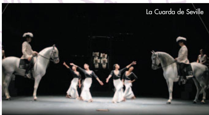
La Cuadra de Seville