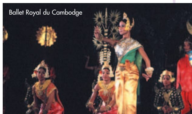
Ballet Royal du Cambodge