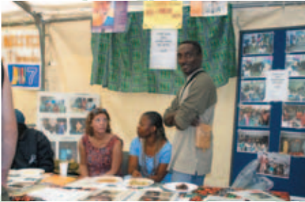
Amicale des Africains