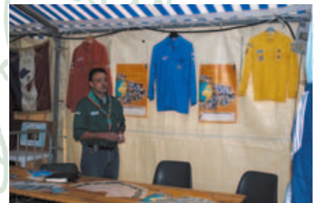
Scouts de France