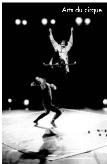
Arts du cirque